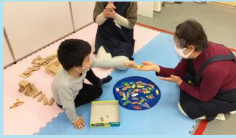
「はい、どうぞ」サイコロと同じ色のキャンディーを一生懸命探し出し、にっこり笑顔で手渡してくれました。