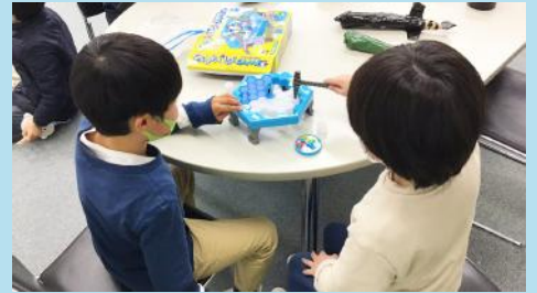
勝負事ですが相手の事を思い、台が動かないように手を添えている姿はとても素敵でした。