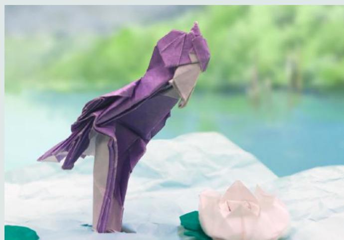
『蓮の花とハシビロコウ』トライアングル通所、中学2年生制作作品

「生活感」は普段から意識していることです。「元気に心健やかにやっていきましょう」といったスローガンを生活レベルに置きかえます。例えば「元気に」は睡眠時間が安定していることや食事が3度摂れること、「心健やか」は朝の支度が前向きに進んでいくこと、学校にも家にも楽しみがある