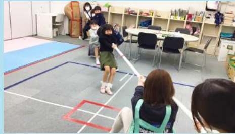
子どもチームと大人チームに分かれて、手加減なしの本気勝負！子どもチームの見事な勝利でした。