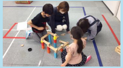
ビー玉がスムーズに流れるよう微調整しながら、皆んなで力を合わせて組み立てました。