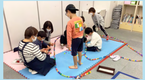
ジスターを全部つなげたらどうなるのかな？自然にみんなが集 まってきました。