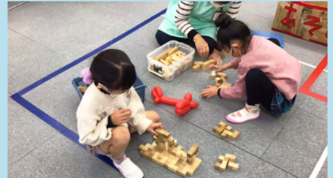
様々な形の積み木を上手に組み合わせていきます。この後、素 敵なお城ができました。