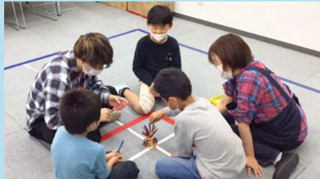
倒さないよう一本ずつ慎重に…。スタッフも一緒に混じっ て真剣勝負です。